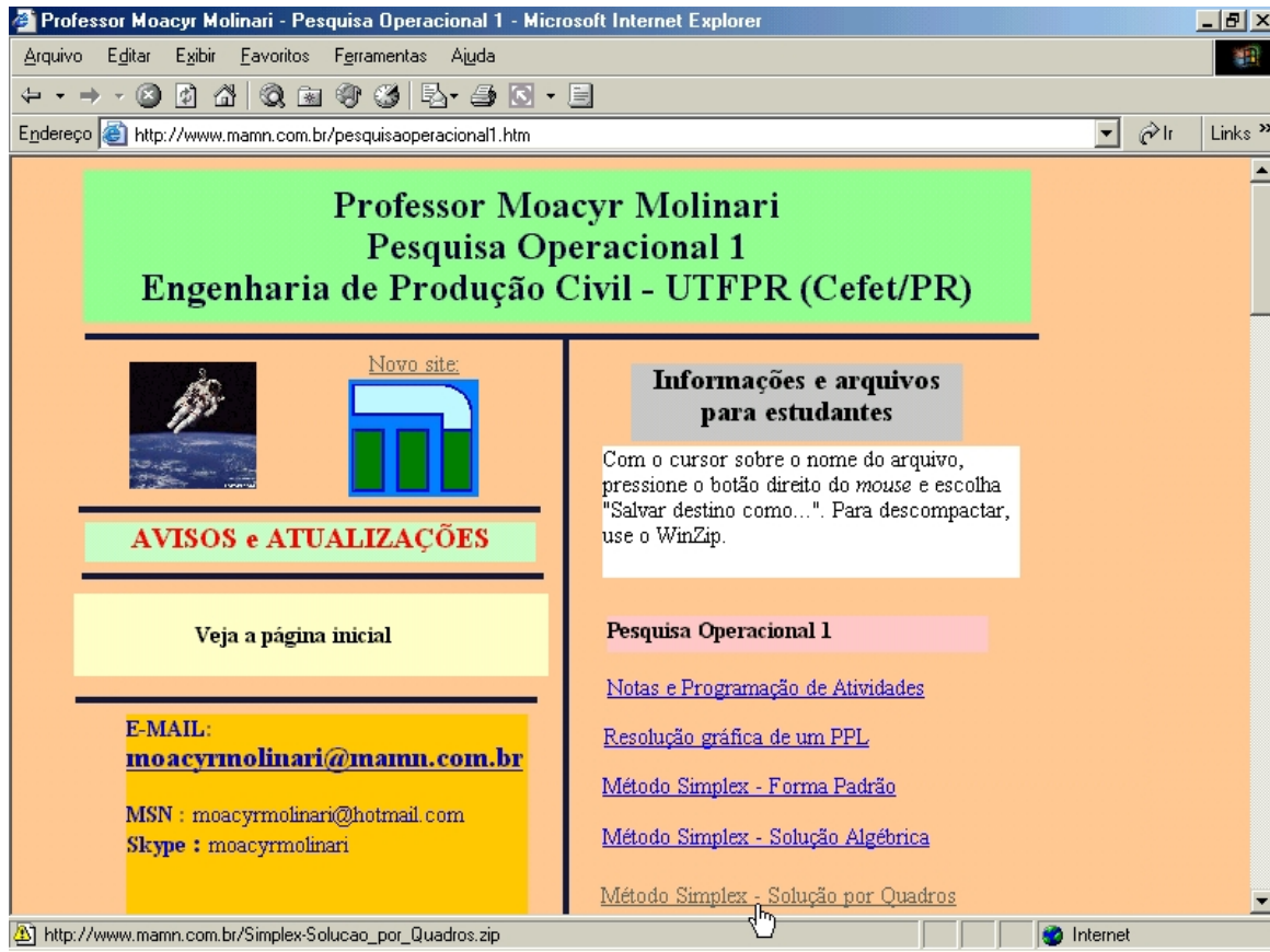
Figura n.º 01 – Reprodução da tela do sítio eletrônico da disciplina Pesquisa Operacional 1

A figura a seguir mostra uma tela do sítio eletrônico citado: